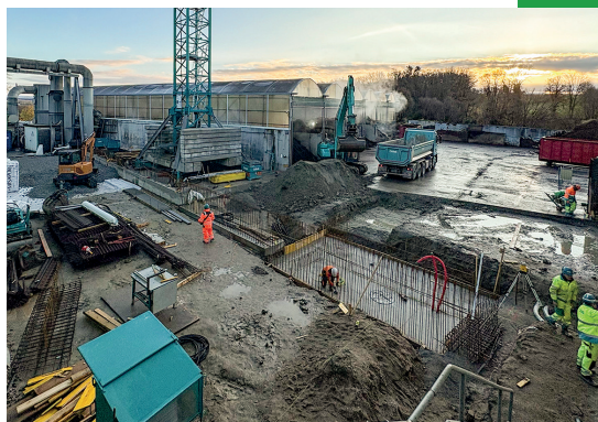
Zone de production en cours de construction.