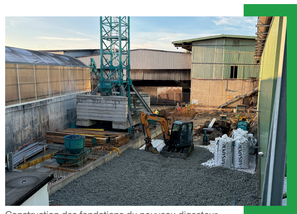
Construction des fondations du nouveau digesteur.

Depuis 2024, un deuxième digesteur à piston de type Kompogas® est en cours de construction à côté du dispositif actuel.